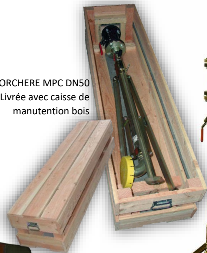
TORCHERE MPC DN50 Livrée avec caisse de manutention bois

Le produit est conforme à la fiche du guide de la distribution GRDF MTOR-015.