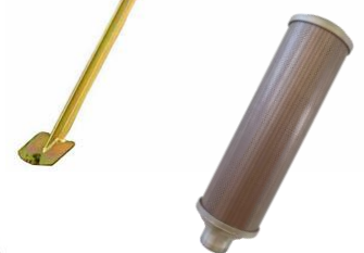
Réf. : CHEV-R250