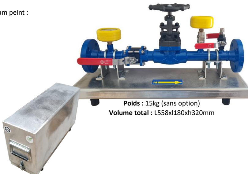
Poids : 15kg (sans option) Volume total : L558xI180xH320mm

La platine de laminage s'installe entre l'organe de décompression du réseau MPC et l'outillage de brulage du gaz selon schéma ci-dessous via les flexibles inox. La pression MPC est dirigée au travers de la vanne de laminage, qui a pour but d'abaisser manuellement la pression aval à 4B maxi – régulation contrôlable au manomètre 0/25B de sortie.