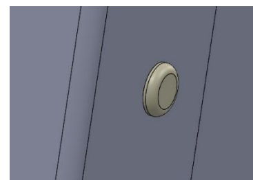
Verrouillage du rivet