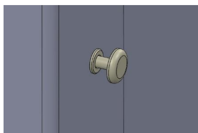
Mise en place du rivet