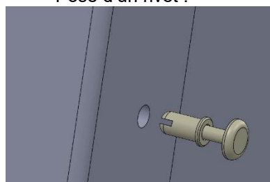
Présentation du rivet