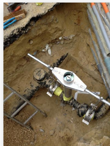
Montage en ligne.