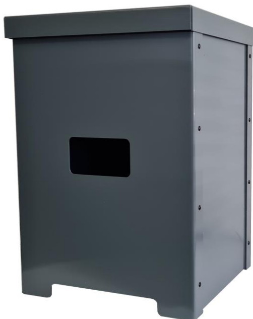
Abri compteur G4