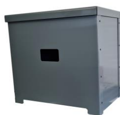
Abri compteur G6/G10

Les côtés peuvent être orientés avec les fixations intérieures ou extérieures.