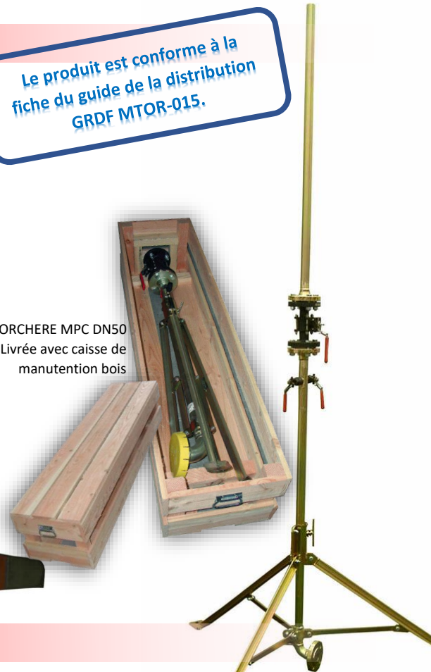
TORCHERE MPC DN50 Livrée avec caisse de manutention bois

Le produit est conforme à la fiche du guide de la distribution GRDF MTOR-015.