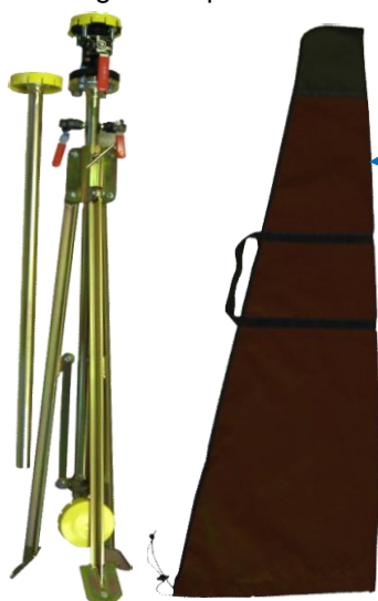
Torchère MPC DN25 repliée et housse de transport

« Pied réglable » pour mise à la verticale de la torchère