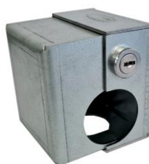
VERROUGAZ ROBINET NF-ROBgaz.