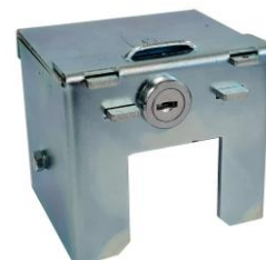
VERROUGAZ ROBINET Manivelle coulissante. (Ancienne génération)